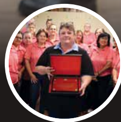
ENCUENTRO de Integración